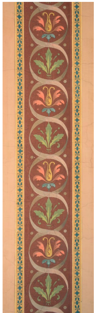
Detail der floralen Zierleisten an der Decke des Knabenzimmers

und Sammlungskästen mit den Initialen von Kaiser Franz Josef vervollständigen das Interieur.